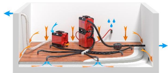
Vakuumtrocknung. Der Trockner trocknet die Luft im Raum, und die Turbine zieht Luft aus der Schichtkonstruktion nach oben, wodurch trockene Luft in die Konstruktion eingesaugt wird.

Bei der Vakuumtrocknung wird die Turbine so angeschlossen, dass sie die feuchte Luft über das Schlauchsystem, den Wasserabscheider und den Filter aus der Schichtkonstruktion heraussaugt und über einen Schlauch aus dem Raum ableitet. Der Einsatz eines Wasserabscheiders ist hier entscheidend. Er verhindert, dass Wasser in die Turbine gesaugt wird und dort Motorschäden verursacht. Der Trockner wird wie gewohnt für die Raumentrocknung installiert.