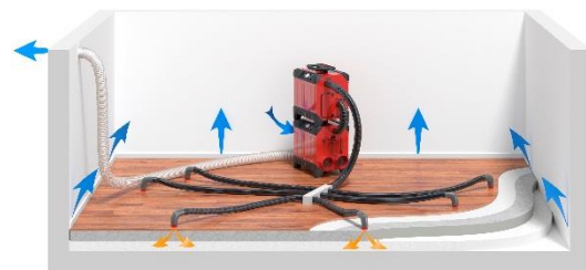
Drucktrocknung. Der Trockner versieht die Turbine mit Trockenluft. Danach drückt die Turbine die Luft in die geschichtete Konstruktion.

Bei der Drucktrocknung wird die Turbine so angeschlossen, dass sie Trockenluft aus dem Trockner in die Konstruktion presst. Auf diese Weise wird trockene Luft in die Konstruktion gepresst, wodurch die Materialtemperatur steigt, was wiederum den Trocknungsvorgang beschleunigt. Feuchtigkeit und abgekühlte Luft gelangen über Spalte zwischen Boden und Wand oder über gebohrte Kontrolllöcher in den Raum, wo sie vom Trockner als Prozessluft eingesaugt werden.